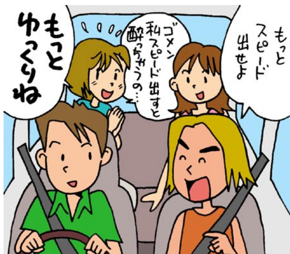
「スピードダウンしよう」の一言が大切です

命を守るための第1の条件は、自分が同乗する四輪車のドライバーが、運転経験がどれくらいあるか、乱暴な人か慎重な人かなど、乗せてもらって安心か